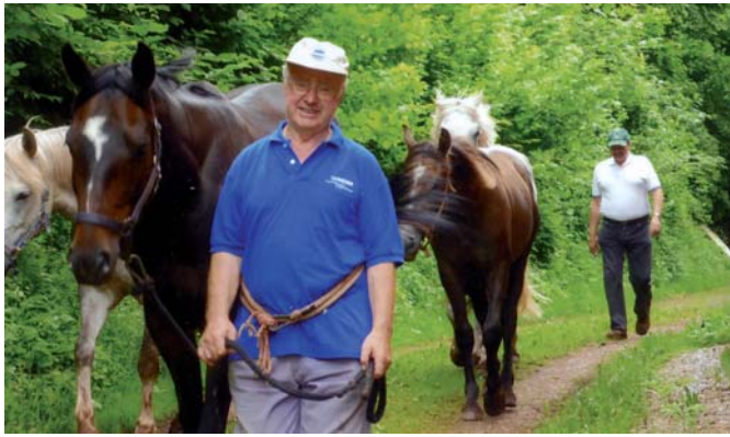
↑ Domácí pán a domácí koně