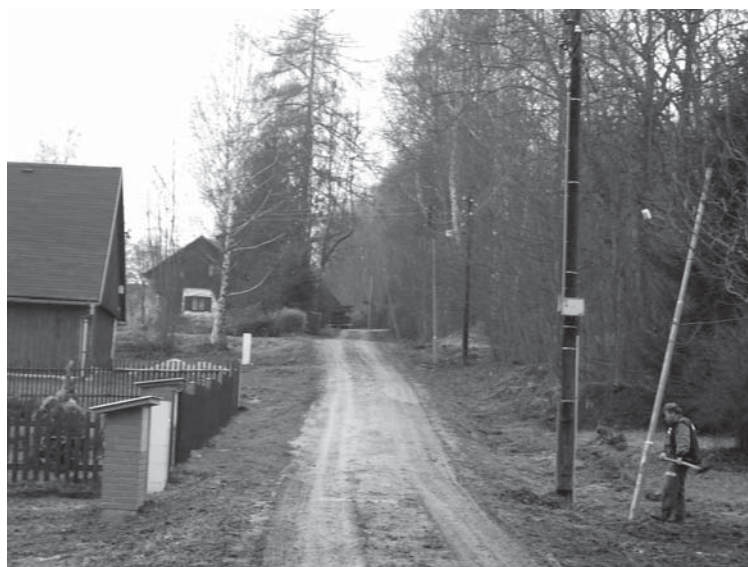
↑ rekonstrukce veřejného osvětlení v Janovicích