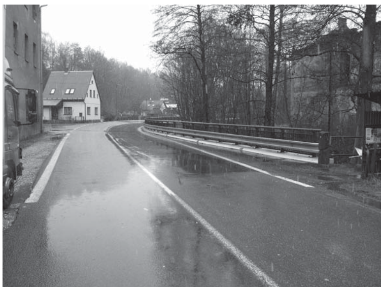
↑ rekonstrukce pobřežní zdi > potok Luční u železářstv