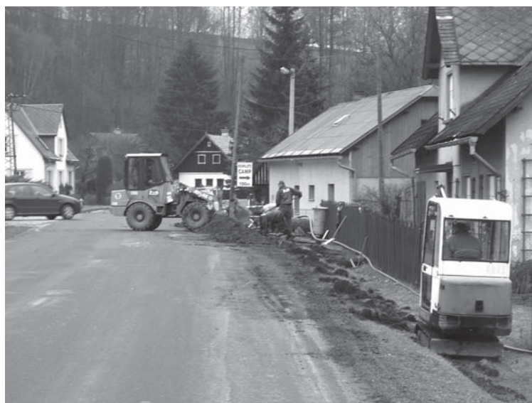
↑ vodovodní přípojky – úsek od st.školy po Bělidlo