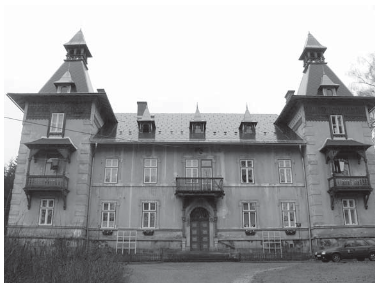
↑ Vila Marie, výměna oken