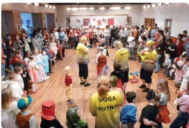
↑ Vosí rojeničko. Fotografie k článku na předchozí straně.