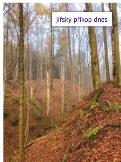
Jiřský příkop dnes

Z německého originálu přeložila Ludmila Jebavá. Pověsti vybrala a úvodem opatřila Olga Hájková. Foto O. Hájková.