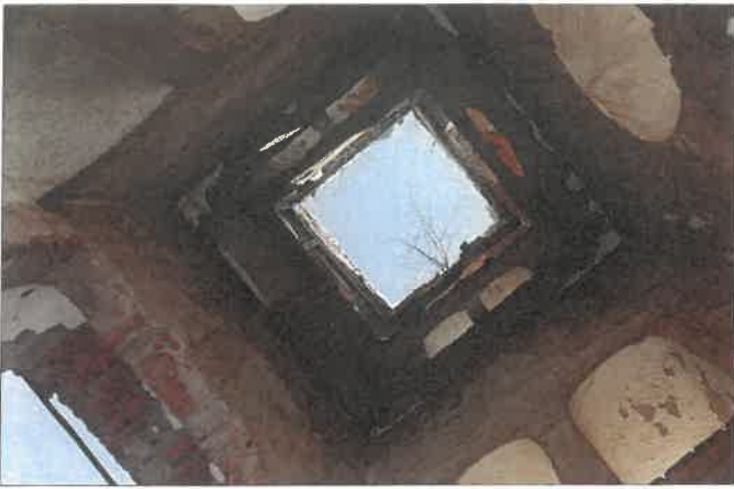
Průhled polozřícenou kostelní věží