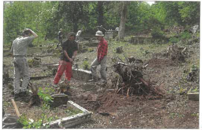
Z obnovy evangelického hřbitova v roce 2010

Bohatý život zdejšího sboru, který provozoval i vlastní školu a domov pro sirotky, patřícího za první republiky k Německé evangelické církvi, končí rokem 1945. Naprostá většina zdejších věřících byla zařazena do „odsunu“ německého obyvatelstva a kostel připadl Církvi československé. Ta se snažila náboženský život udržet do roku 1948, kdy tu proběhly poslední bohoslužby.