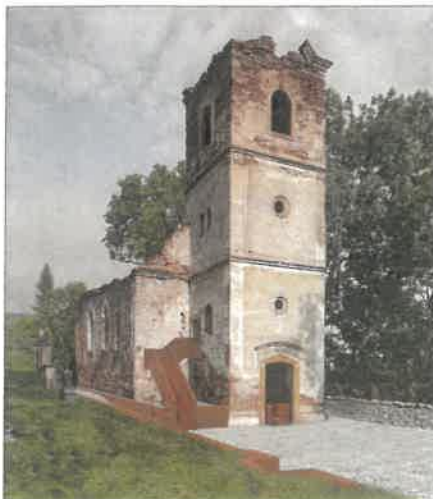
archiv Daniela Hakulína

↳ Vizualizace návrhu architekta Daniela Hakulína, který si před lety získal největší pozornost Rudnických